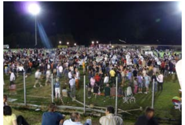
San Sisto: Targa Ricordo