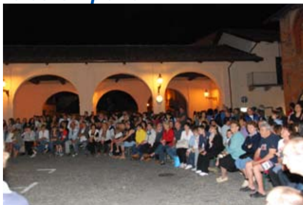
La lotteria organizzata dalla Proloco